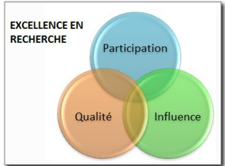
Figure 1. Diagramme provisoire de l'« excellence en recherche » utilisé au Forum d'apprentissage pour amorcer le dialogue

Pour faire progresser les échanges, nous avons choisi 18 premiers critères vi qui illustraient l'étendue des diverses