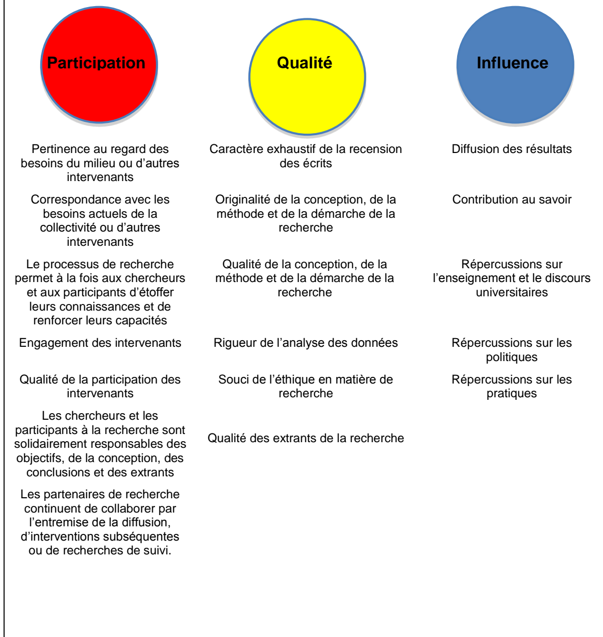
Figure 2. Trois catégories d'excellence en recherche Critères du cadre provisoire